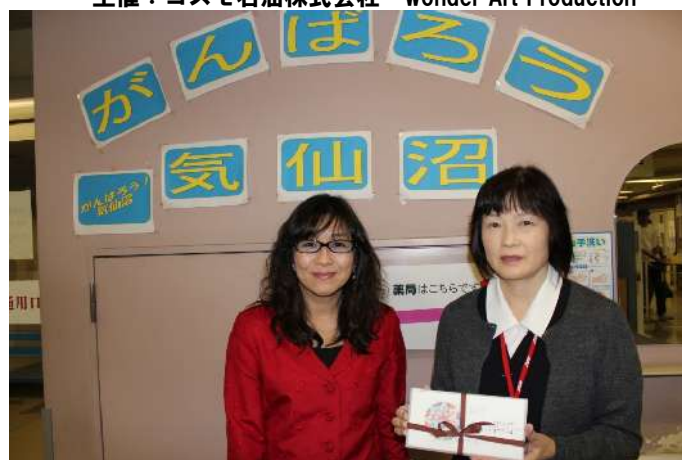
気仙沼市立病院 クリスマスカードをお届けしました。