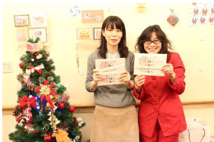
宮城県立こども病院 クリスマスカードをお届けしました。