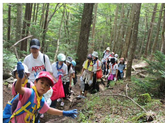
自然豊かな遊歩道をぬけて小富士(1979m)登頂