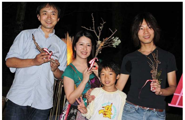
ゲストに駆けつけてくれたのは Little Voice of FUKUSHIMA のみなさん