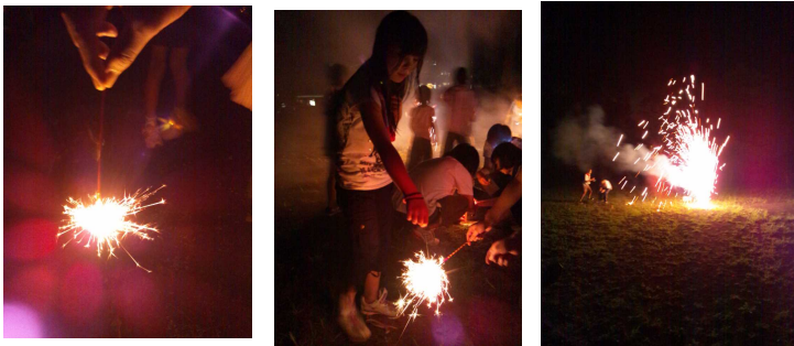
花火も、遊ぶのも、食べるのも、寝るのもみんな一緒 とっても楽しかったね！