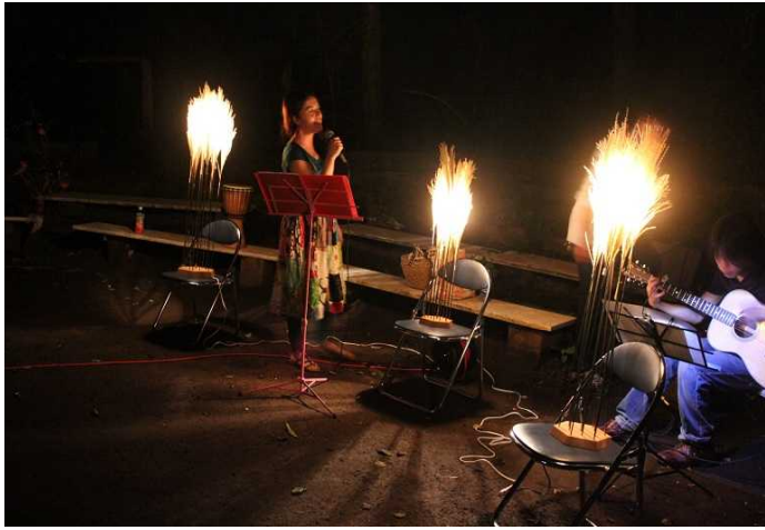
夜は森の中で、植物の灯りを灯してライブコンサート