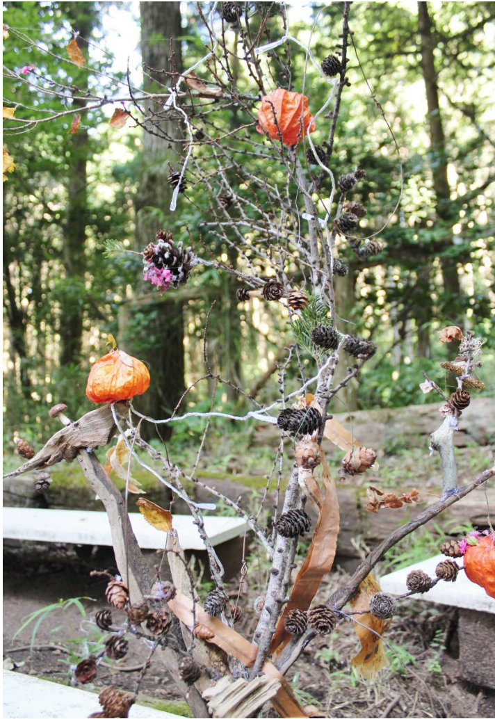
自然物でつくる「植物の灯り」ワークショップ