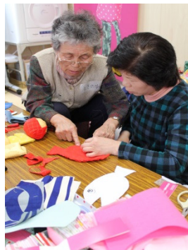
「またくるよ～」 ニコニコの一日でした☆